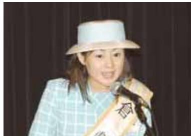
唱和文唱和 第25代倉敷小町