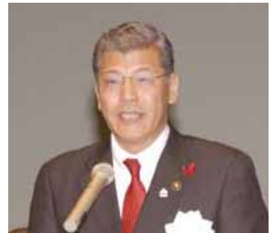
開催地市長歓迎のことば 古市健三 倉敷市長