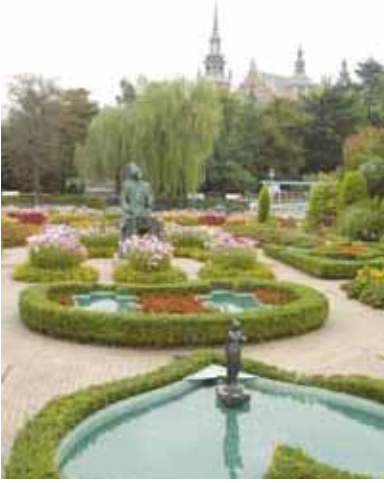
交流交歓会会場 倉敷チボリ公園 アンデルセンホール