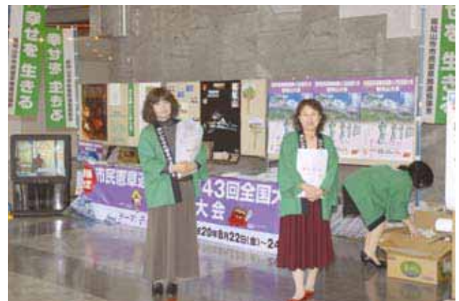
次期開催地コーナー（福知山市）