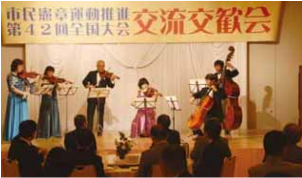
弦楽合奏 倉敷弦楽アンサンブル