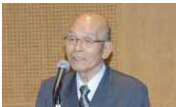
開会あいさつ（福知山市）