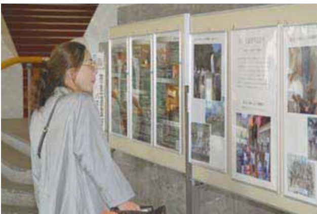
市民憲章活動紹介コーナー