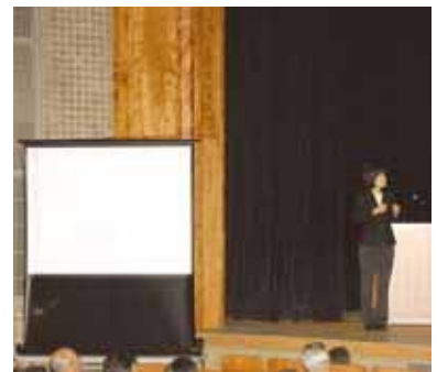
手話通訳と 要約筆記ボランティア