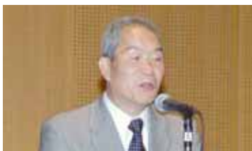
閉会あいさつ（花巻市）