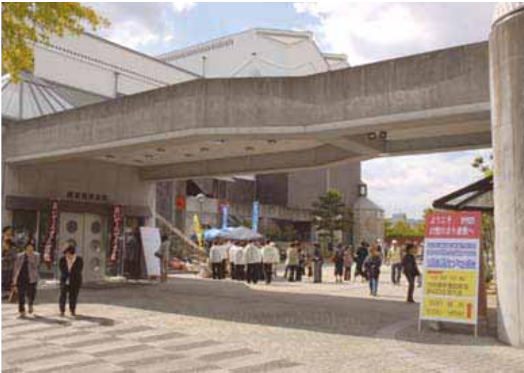
大会会場 倉敷市芸文館