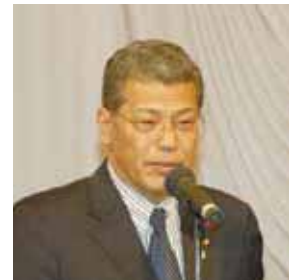
開催地市長あいさつ 古市健三 倉敷市長