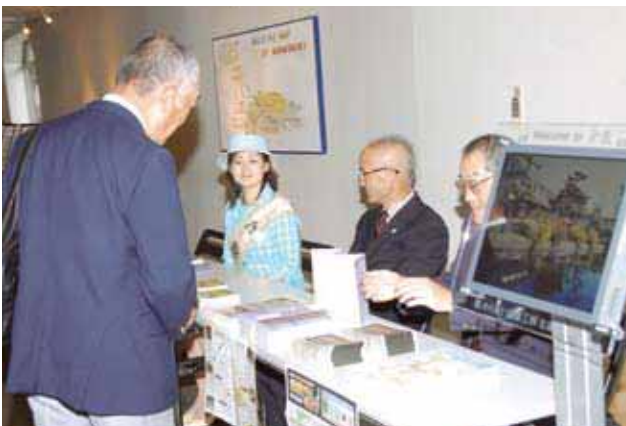
倉敷市観光コーナー