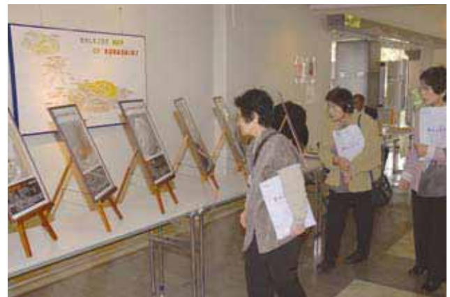
倉敷ブランド紹介コーナー