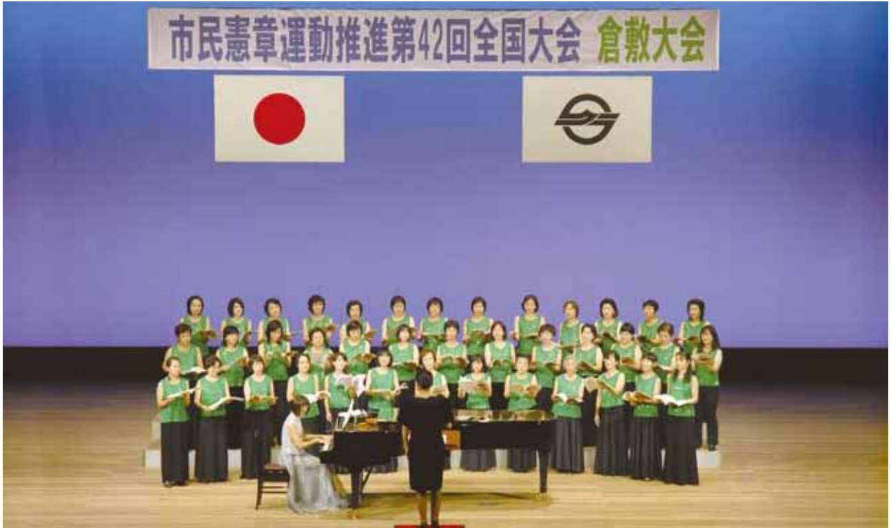
大会オープニング 女声合唱組曲「倉敷の四季」 倉敷コール・クライネ