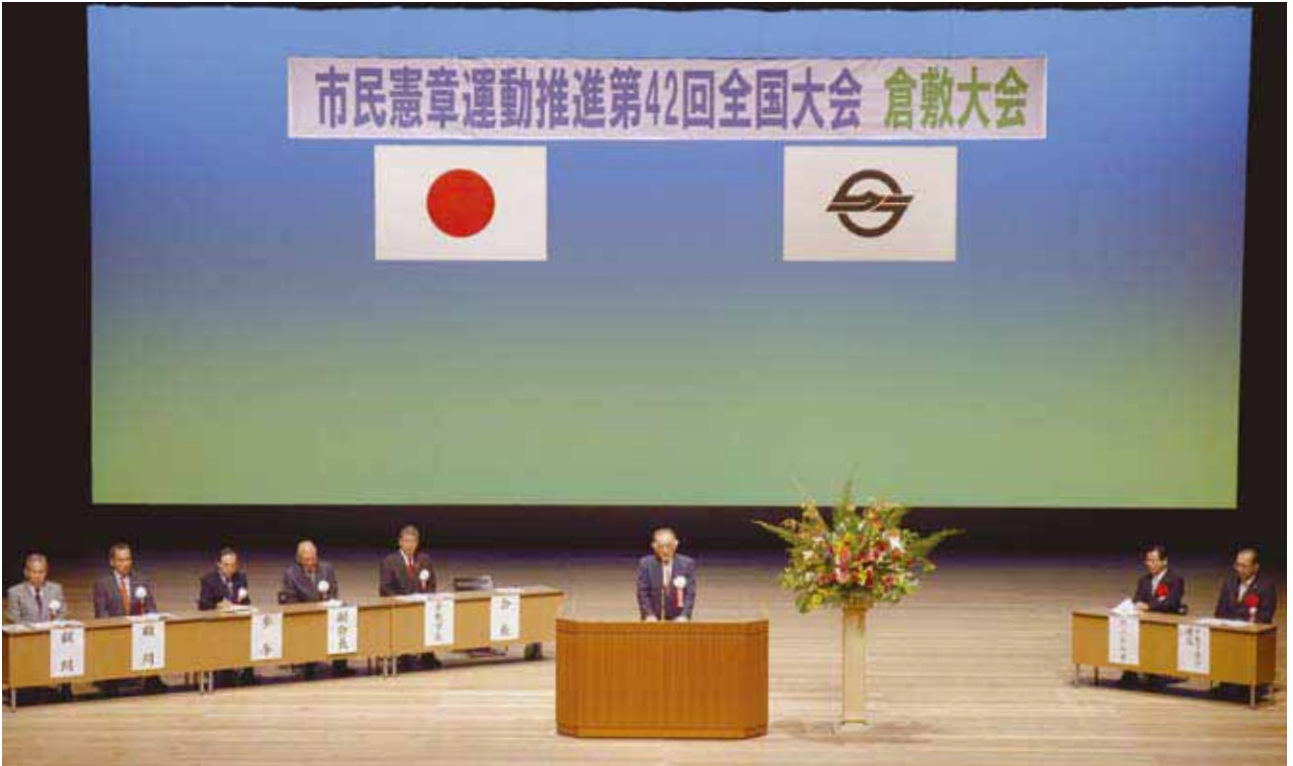
市民憲章運動推進第 42 回全国大会