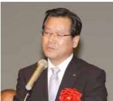
祝辞（岡山県知事代理） 杉 潔 岡山県企画振興部長