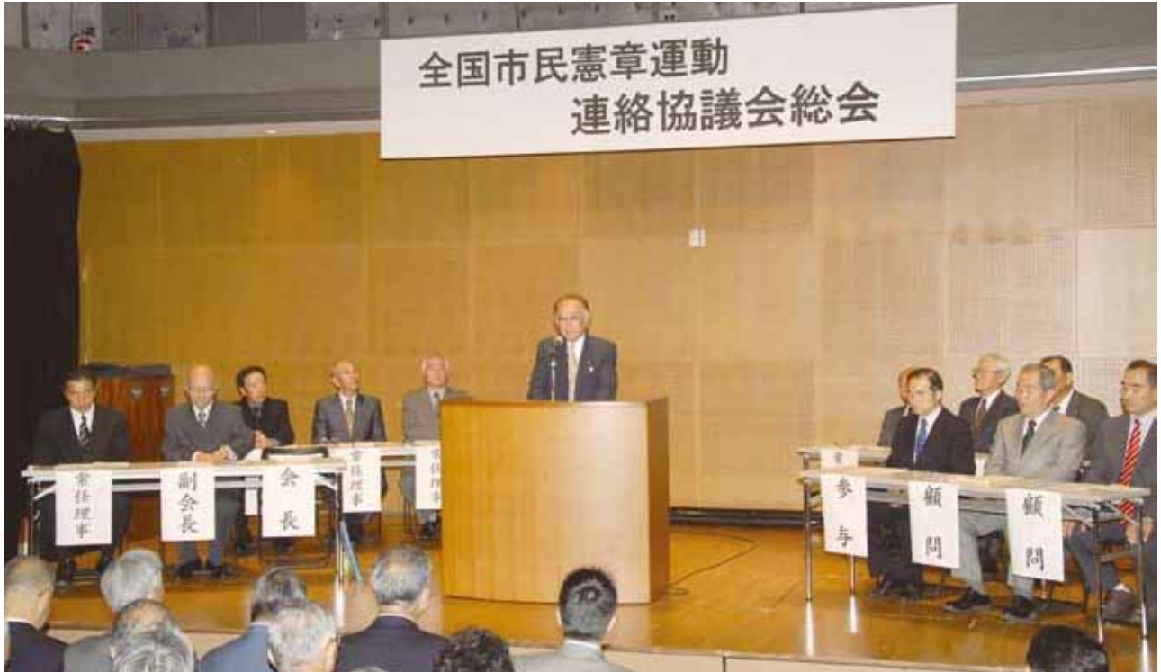
平成 19 年度全国市民憲章運動連絡協議会総会