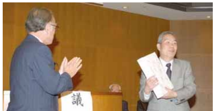
記念品贈呈 前年度開催地・花巻市