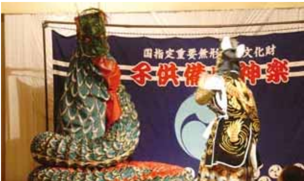
国指定重要無形民俗文化財 子供備中神楽