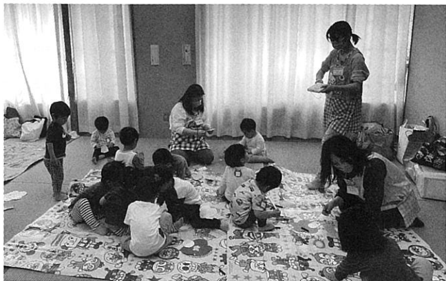
「母子分離育児サークルキラキラキッズ」ママは自分の時間を。スタッフはすべて地域のママ、過去の参加者。助けてもらったから今度は自分が助ける側に