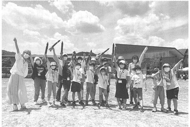
「子どもロケット体験教室」

パートナー契約を結び小中学校へのキャリア教育プログラムの実施を目指す。子どもの周り360度に様々な価値観（大人）を。親、教師、塾の先生以外の様々な大人たちと関わることによって、自分を知り、社会を知り、自立する力をつけられるように。自力でプログラムを行えるようナビゲーター養成講座を行い、地域の大人たちが学校に入る環境を整えた。