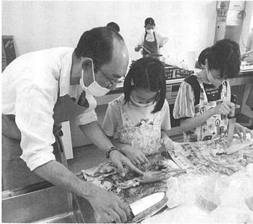
「KMP お弁当の日&自炊塾」 お魚屋さんで自分の好きな魚を買い、魚料理が得意な地域のパパから魚のさばき方を習って調理