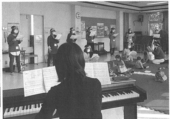
「ママとキッズのコーラス隊 COLORS」