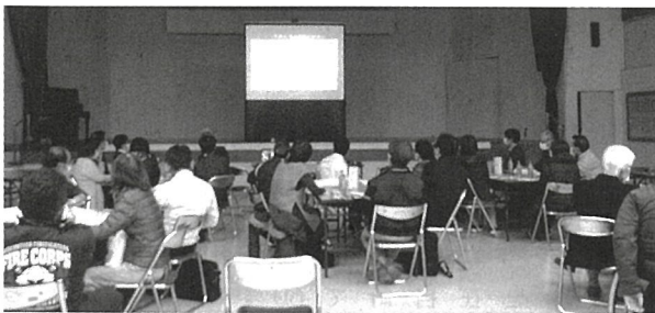
八幡校区・京都大学「桜島大噴火事前避難」ワークショップ

本来、火山防災はひとつの地域の手に負えるものではありません。大正噴火レベルの火山噴火は、その後国内ではありません。人口60万人の近代都市が1メートル以上の軽石・火山灰に埋ったという記録などもないのです。火山大噴火は極めて希少なものはありますが、桜島が近い将来大噴火を起こす恐れがある以上、私たちは手を拱いているわけにはいきません。何よりも重要なことは大噴火勃発時に犠牲者を出さないことです。そのためには、可能な限り多くの住