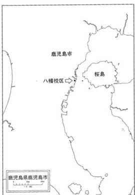
鹿児島市八幡校区の位置

鹿児島市八幡小学校区（通称：八幡校区）は、鹿児島市のほぼ中心部に位置します。北方は二級河川・甲突川の河口部、東側は鹿児島湾に接し高層住宅と戸建て住宅の混在化がすすむ市街地区です。人口約17000人、世帯数9600世帯で、人口密度の比較的高い地域になります。