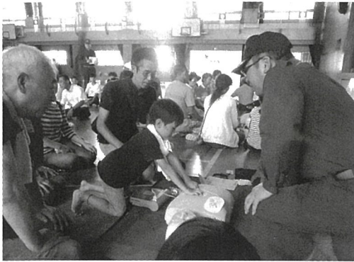
校区自主防災会連絡会が実施する「避難所訓練」