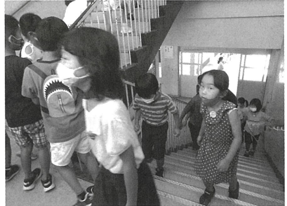
津波を想定した児童クラブの防災訓練

27000世帯、45000人は南さつま市に避難することになっています。はたして計画は現実的なものか。避難道路の渋滞、宿泊施設の絶対的不足などあまりに問題点が多く、多くの住民が賛同することができない避難計画だということが、ワークショップでも指摘されています。現に、鹿児島市民の間でもこの計画の議論はすすんでいないのです。