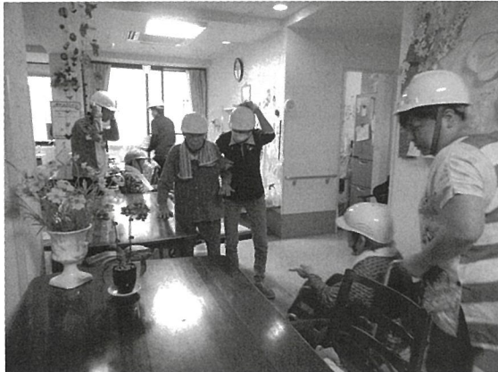
甲突川氾濫を想定した福祉施設・地域合同訓練