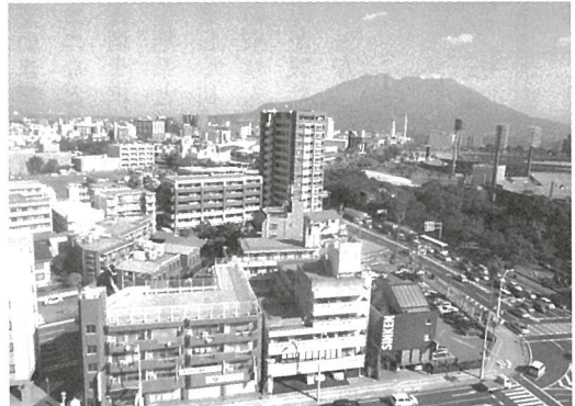
八幡校区住宅街（手前）と眼前の活火山・桜島

八幡校区は活火山・桜島の火口から距離わずか8.6キロメートル、沖積層地盤上に形成された標高2〜3メートルという低地にあります。桜島がひとたび大噴火を起こすと風向