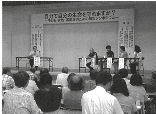
県女連と八幡校区共催「防災シンポジウム」

ジウム」(200人参加)を開催、今後2年ごとに開催の予定です。また毎年秋に実施する「校区スポーツフェスタ」では、防災種目をプ