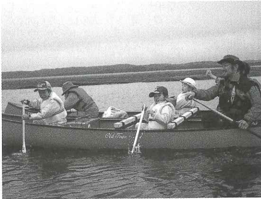
地元のカヌーガイドを招き、湿原の中を探検

自然を大切にする最初の一步は「そこを知る・好きになる」ことです。そのため環境教育や交流、エコツアーなどを通して霧多布湿原のファンづくり活動をしています。