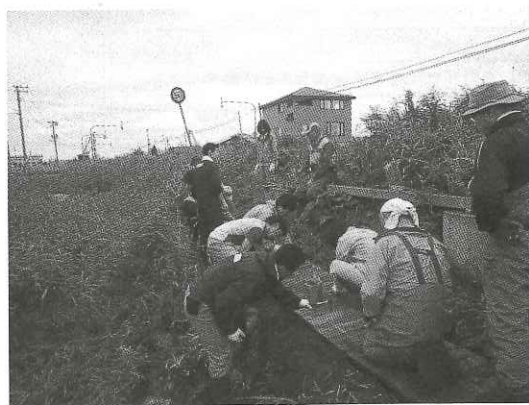
支援してくださっている企業の方々や地元の高校生がボランティアとして参加し、木道整備を行っている

環境教育とは、森・川・湿原・海といった様々なフィールドを活かし地域の自然や人とつながった体験学習・総合学習プログラムです。プログラムの一つにきりたっぷ子ども自然クラブという小学生対象の自然体験活動があります。自然の中で遊ぶことを通してたくましい子に育ってほしいという想いから2006年にクラブを結成しま