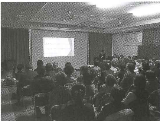
地域住民の前で伊野の将来デザインを発表

まちづくりに関わる人は年々増えてきたが、地区住民だけでは手に負えない部分も多い。昨年、伊野地区出身者や伊野のまちづくりに関心を寄せる人びとに1口5千円の寄付で「ふるさと会員」になってもらい、伊野のまちづくりと一緒に考えてもらおうと呼びかけたところ