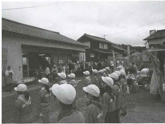
お客様の前で「伊野いちの歌」を披露する伊野小児童

ツマイモの販売に加え、おもてなしコーナーでお客様接待、お客様の荷物運び、商品紹介など、スタッフとして働く。 昨年、先生と子どもたちは学習のまとめとして「伊野いちの歌」と「ふるさと伊野」の歌をつくり、今年、お客様の前でライブコンサートを行って披露した。子どもたちの活動は私たちに元氣と希望を与えてくれている。集客力の増加にも貢献している。