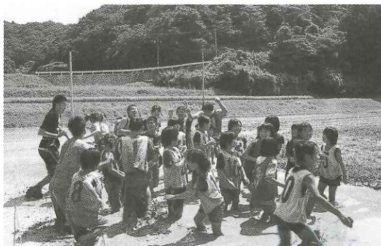
伊野バージョン—田んぼでどろんこ運動会—