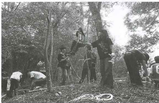
伊野バージョン—秘密基地づくり—

もの遊びを創る」をコンセプトに、森で秘密基地づくり、田んぼでどろんこ運動会、海でいかだレースなど、自然を舞台にした遊びを通して心と体を開放する活動が2013年から始まった。子どもたちが外遊びする光景がめっきり増え、「伊野いち」とともに「伊野バージョン」は、伊野の代名詞となった。