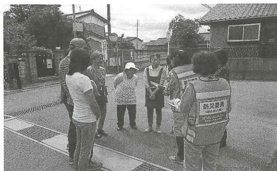
安否確認のプロ・女性防災委員

東北豪雨災害」で、各避難所や親類宅に分散した町民と町内会を結ぶ情報共有の手段として「SMS一斉送信システム」が驚異的な効果を発揮した。決壊前の鬼怒川の水位情報の発信から始まり、決壊時の避難喚起、決壊後の地区内の浸水状況や帰宅のための道路情報、支援物資の入荷情報、災害ボランティアさんの手配情報など、合わせて50通の緊急情報を浸水した地区内から町民の携帯電話に発信し続けた。