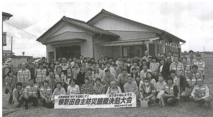
根新田自主防災組織決起大会