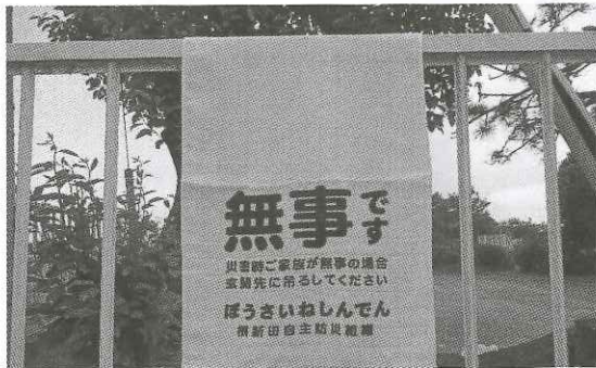
「黄色いタオル」を掲げてから隣近所の安否確認