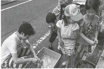
小学生だった子どもが高校生になり、ボランティアをしている様子