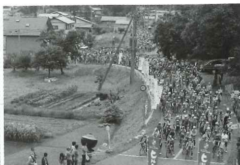
夏油高原ヒルクライム 800余名スタート前

通じて被災地に元気を届けようとの考えのもと予定通り実施を決めた。地元民にとって全くなじみのない自転車レースをどのようにサポートすべきか戸惑いが多かった。しかし、