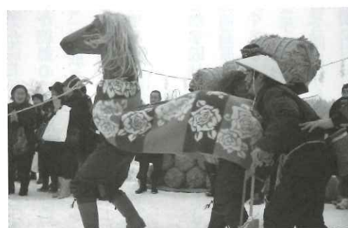
岩崎地区青年団の活動 福豆鬼節分会(2月)

かつて行っていた夏油高原マラソン大会の経験を活かし、コース上の安全警備や選手のおもてなしなど、地域ボランティアとして老若男女100人以上の支援と、沿道の温かい応援とで大会を支え、地域の一大イベントとしてこれまで通算9回を数えるまでになった。