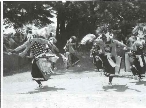
郷土芸能 岩崎鬼剣舞(国指定)

また、地域の新たな名物をつくるなどの発案でオリジナル料理「岩崎だんご汁」を開発した。郷土食の米粉だんごと子どもから大人ま