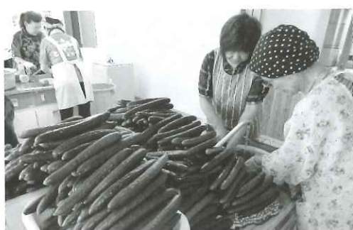
選手昼食おもてなし用のキュウリ漬け作業