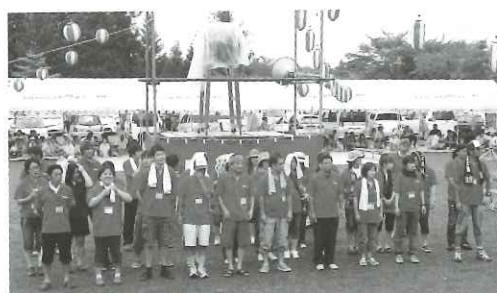
岩崎地区青年団の活動 虹色フェスタ(8月)